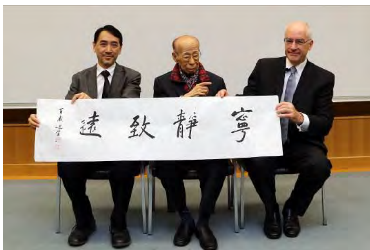
第四屆饒宗頤講座