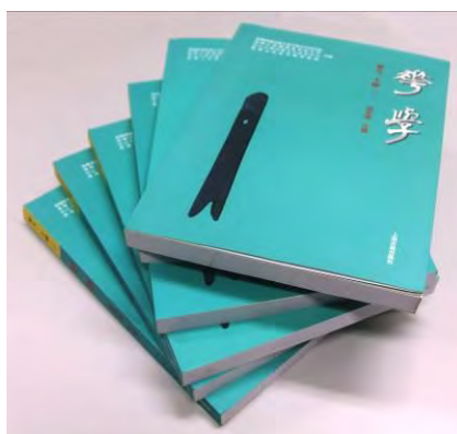
饒宗頤先生九十華誕 國際學術研討會論文集（《華學》第九、十合輯）

《華學》由饒宗頤教授於 1993 創立，第七輯至第十輯，為本館與（泰國）崇聖大學中華文化研究院、（北京）清華大學國際漢學研究所、（廣州）中山大學中華文化研究中心聯合主辦的學術期刊。其中第九、十輯合刊則由本館負責全部之編校及出版事宜。