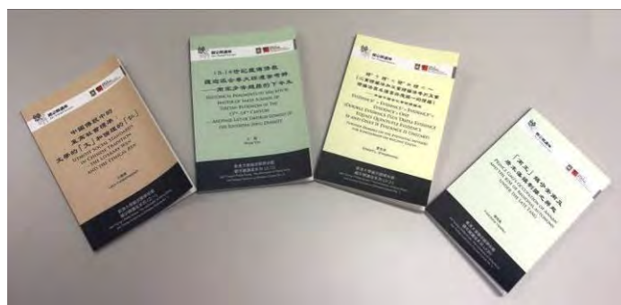
《香港大學饒宗頤學術館·饒宗頤講座系列》第 1-4 屆論文特集

《香港大學饒宗頤學術館·饒宗頤講座系列》是「饒宗頤講座」的論著出版系刊，由香港大學饒宗頤學術館編輯及出版，出版經費同由饒學研究基金資助。