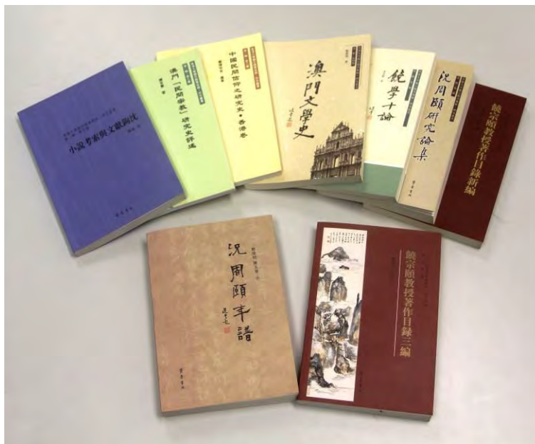
《香港大學饒宗頤學術館·研究叢書》第一及第二輯

《香港大學饒宗頤學術館·研究叢書》第一輯，由饒宗頤教授擔任顧問，李焯芬教授擔任主編，香港大學饒宗頤學術館學術部組成編輯委員會，本系列原計劃出版六種著作，前五種於 2010-2012 年已由（濟南）齊魯書社出版，最後一種分為兩卷於 2015 年由香港大學饒宗頤學術館出版。本系列獲香港大學饒宗頤學術館之友、饒宗頤基金有限公司、許崇標先生資助研究經費，並獲香港大學人文基金資助編輯及出版經費。