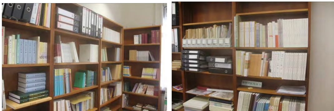
饒宗頤教授資料庫暨研究中心

未來「饒學中心」將繼續擴大庫藏、完善系統，以及開展整理及研究各種庫藏資料等，並加以出版，以期進一步實踐饒教授納藏於用的理念，將庫藏資料介紹予研究者。