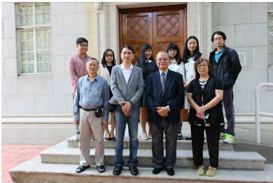
學術部同人與館長李焯芬教授（前排右二）合影