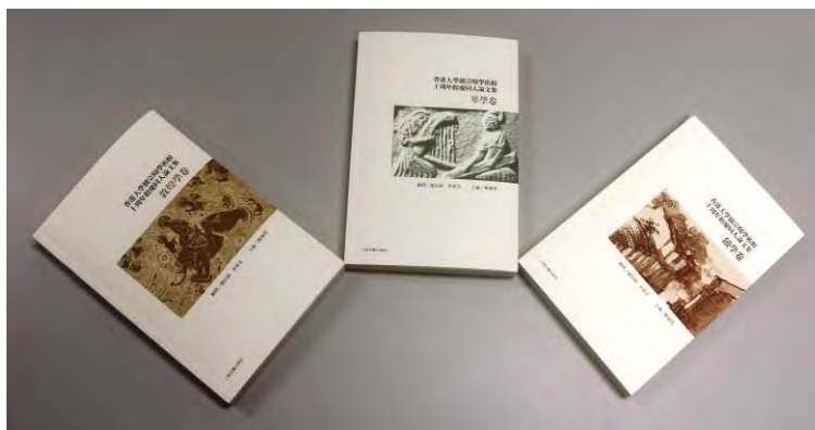
《香港大學饒宗頤學術館十周年館慶同人論文集》

《香港大學饒宗頤學術館十周年館慶同人論文集》是作為香港大學饒宗頤學術館成立十周年誌慶的論文結集，分為琴學卷、敦煌學卷及饒學卷。本系列由饒宗頤教授、李焯芬教授擔任顧問，鄭焯明博士擔任主編，香港大學饒宗頤學術館組成編輯委員會，由（上海）上海古籍出版社於 2014-2015 年出版。