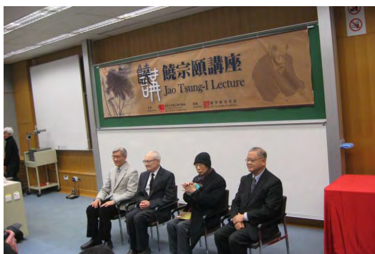
第一屆饒宗頤講座