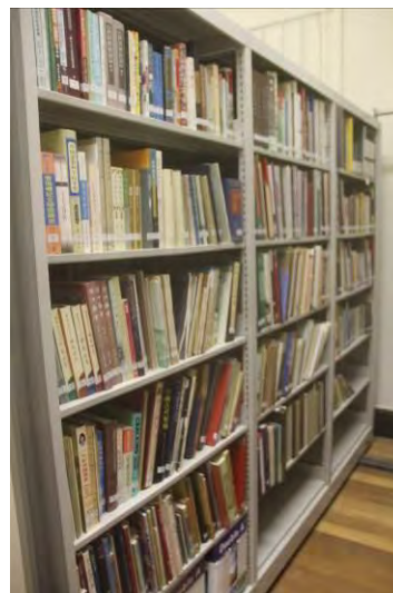
選堂文庫特藏室——簽名本