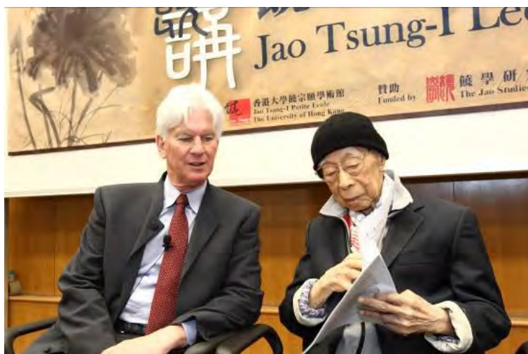
第三屆饒宗頤講座