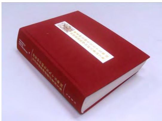
慶賀饒宗頤先生九十五華誕 敦煌國際學術研討會論文集

會議成果：中央文史研究館、敦煌研究院、香港大學饒宗頤學術館編：《慶賀饒宗頤先生九十五華誕敦煌學國際學術研討會論文集》(北京：中華書局，2012年)。